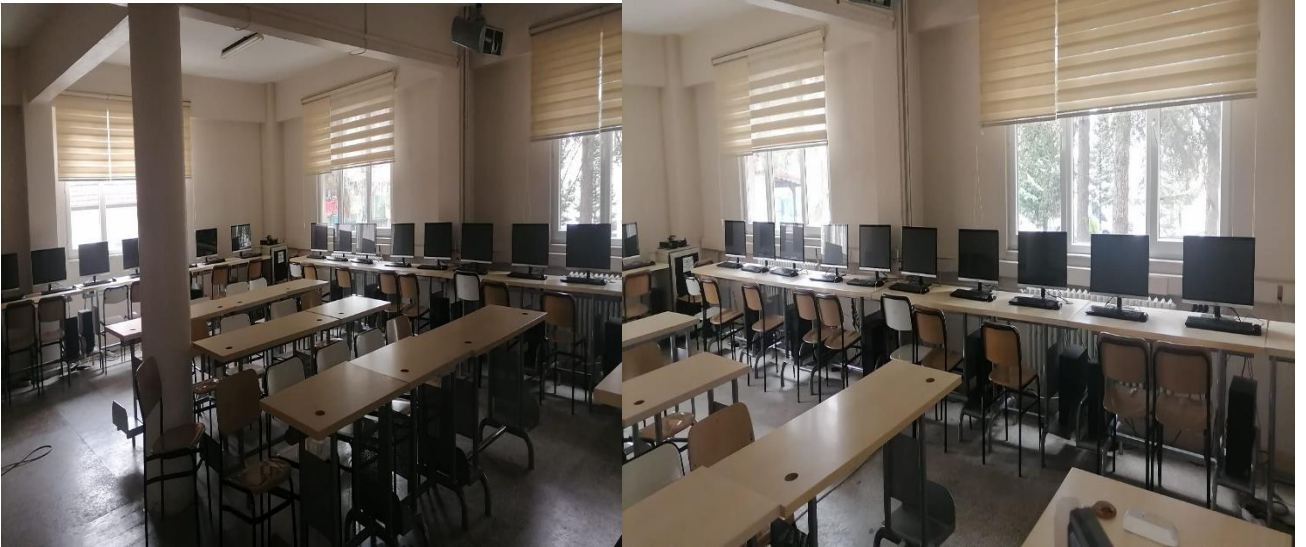
Şekil 2. Derslik ve laboratuvarlarımız

Hendek Meslek Yüksekokulu Yerleşkesine 3-4 Km mesafede Kredi Yurtlar Kurumu'nun (KYK) 800 kişilik kız ve erkek öğrenci yurdu bulunmaktadır.