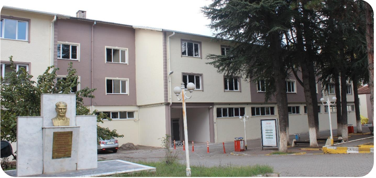
Şekil 1. MYO Yerleşkemiz

Mesleki eğitim-öğretimde hedeflediği yüksek kalite standartlarıyla mezunlarına uygulama becerisi kazandırma yetkinliği ile ulusal ve uluslararası düzeyde adından söz ettiren; iş dünyası ile iş birliği içinde geleceğin nitelikli işgücü ihtiyacını karşılamaya yönelik etkili çözümler üreten, takım çalışmasını teşvik eden, demokratik, şeffaf, iletişime ve değişime açık bireyler yetiştirmek amacımızdır.