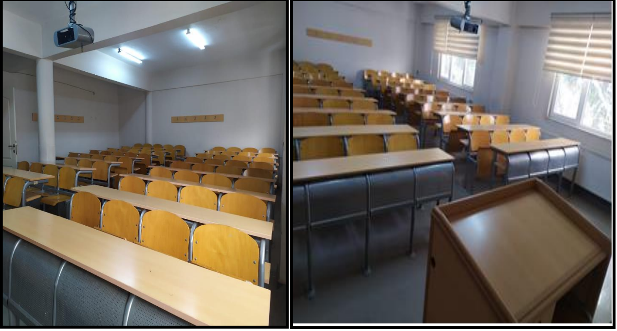
Şekil 2. 4. Derslikler