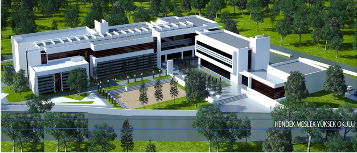
Şekil 2. 2.OSB Yerleşkesinde yer alan Yeni MYO Planı

Hendek İlçesinde Kredi Yurtlar Kurumu'nun (KYK) 1352 kişilik kız ve 675 kişilik erkek olmak üzere 2 öğrenci yurdu vardır. Ayrıca çeşitli özel kız-erkek yurt ve pansiyonları da bulunmaktadır.