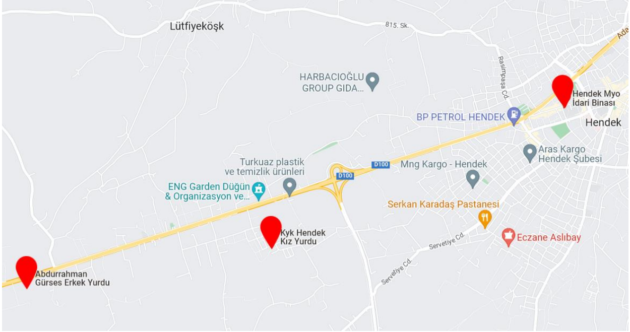
Şekil 2. Okulumuz ve KYK Yurtları

Hendek Meslek Yüksekokulu Yerleşkesine dört kilometre mesafede Kredi Yurtlar Kurumu'nun (KYK) 1352 kişilik Kız, 675 kişilik Erkek öğrenci yurdu bulunmaktadır.